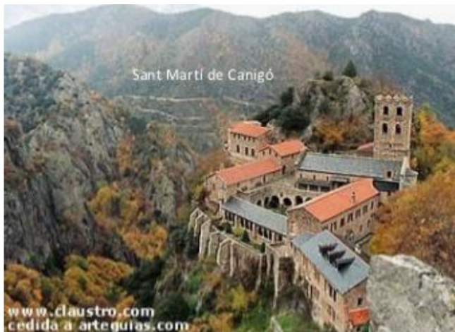
Sant Martí de Canigó

- No! Pel camí de Codalet i Prada sols minaires obiro i llauradors; diu que torna a son arbre la niuada, mes, aï!, la que deixà nostra brancada no hicanterà mai més dolços amors.